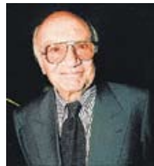
El director italiano Francesco Rosi.

época de la humanidad, esta llamada de atención, realizada con este cariño y este conocimiento debería ser un libro de texto en las escuelas. Debería.